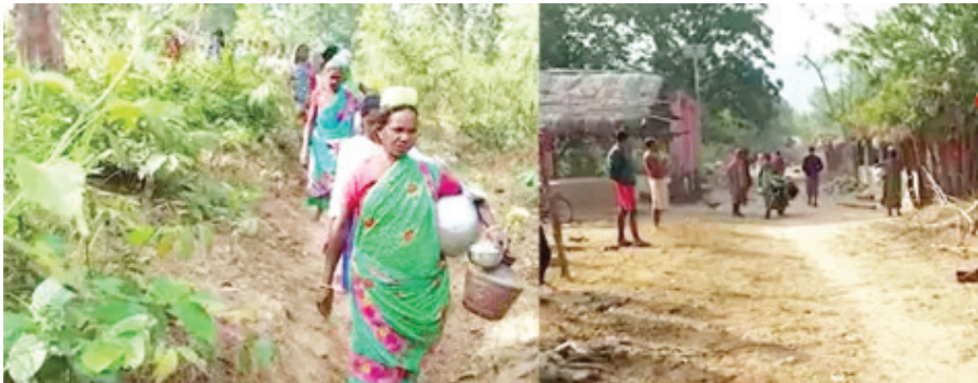
ରକ୍ଷଣାବେକ୍ଷଣ ଅଭାବରୁ ତାହା ଏବେ ଖରାପ ହୋଇ ପଡ଼ିରହିଛି । ଫଳରେ ଲୋକେ ରାତିରେ ଅନ୍ଧାରରେ ଜୀବନ ବିତାଉଥିବା ବେଳେ ପିଲା ମାନେ ପାଠପଢ଼ିବାରେ ବିଶେଷ ସୁବିଧାର ସମ୍ମୁଖୀନ ହେଉଛନ୍ତି । ହଳଦୀପାଣି ସାହିରେ ପିଇବା ପାଣିର କୌଣସି ସୁବିଧା ନାହିଁ । ସାହିରେ ରହିଛି କେବଳ ଗୋଟିଏ

କେନ୍ଦୁଝର: କେନ୍ଦୁଝର ଜିଲ୍ଲା ତେଲକୋଇ ବ୍ଲକର କରମଙ୍ଗୀ ପଞ୍ଚାୟତର ଅଲୁଣି ଗାଁ ହଳଦୀପାଣି ସାହି । ଏଠାରେ ବସବାସ କରୁଛନ୍ତି ୨୮ ଆଦିବାସୀ ପରିବାର । ଛୁଇଁଭାଗ୍ୟର କଥା ଏହି ଗାଁ ଲୋକଙ୍କ ପାଖରେ ସର୍ବନିମ୍ନ ମୌଳିକ ସୁବିଧା ଅପହଞ୍ଚିତ ହୋଇରହିଛି । ରାସ୍ତାଘାଟ ଠାରୁ ଆରମ୍ଭ କରି ବିଦ୍ୟୁତ ସମସ୍ୟା ଓ ପାନୀୟ ଜଳ ସେମାନଙ୍କ ପାଇଁ ସାତସପନ ପାଲଟିଛି ।